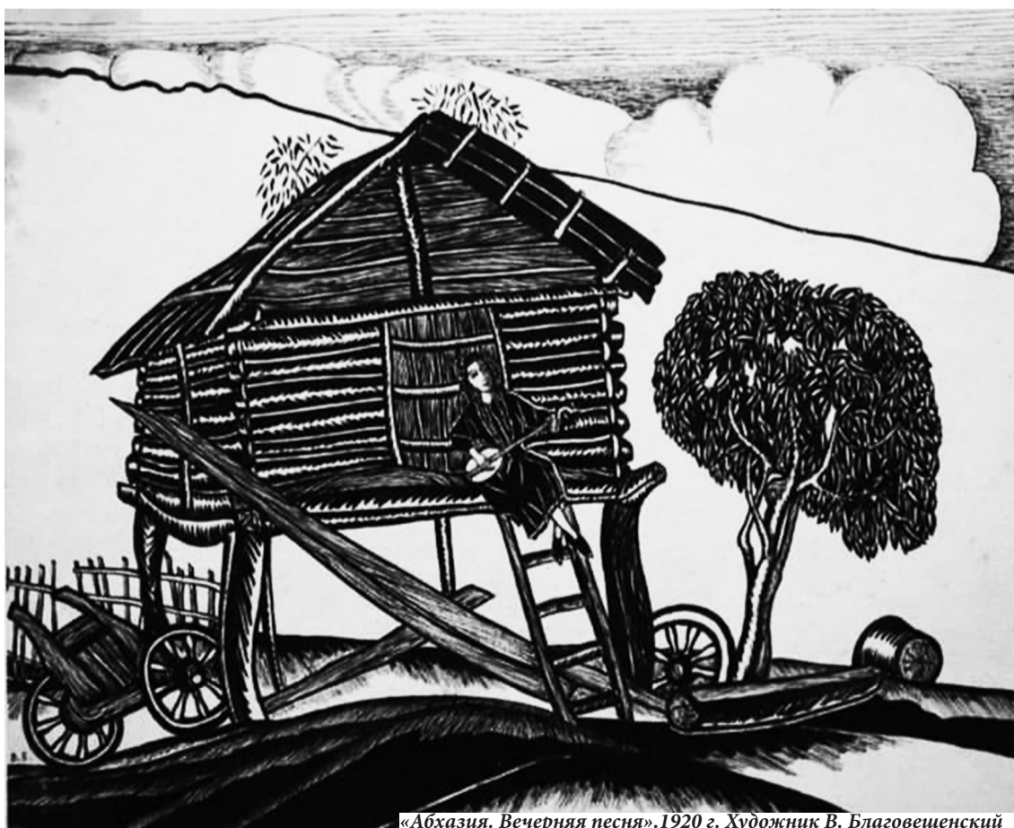
«Абхазия. Вечерняя песня». 1920 г. Художник В. Благовещенский