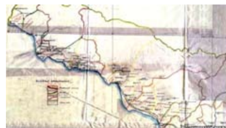
Фрагмент карты избирательных округов Абхазии 1937 года

два года этим занимаюсь. Главная цель нашей выставки – популяризировать деятельность архивов, показать, что они хранят нужную информацию, они хранят нашу историю, нашу жизнь, историю нашей семьи и нашего города. Популяризировать использование архивных документов в решении экономических проблем, проблем социально-общественного характера. Выставка посвящена туризму и градостроительству, эти темы весьма актуальны для Абхазии, поэтому мы ее подготовили, чтобы показать,