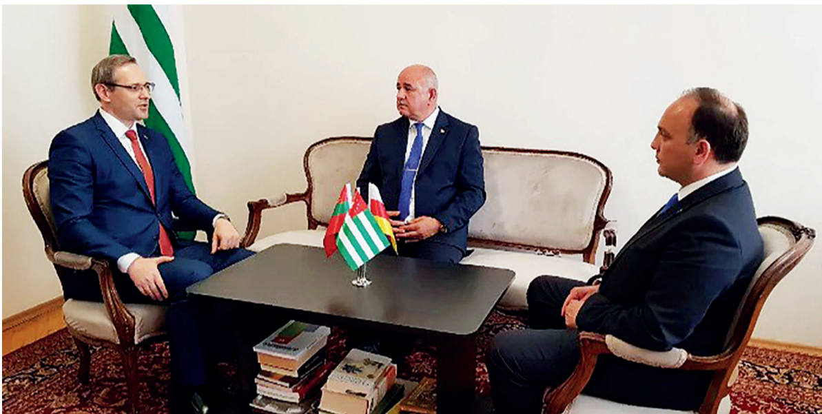
17 мая в Сухуме состоялись 3-х сторонние консультации министров иностранных дел ПМР, Южной Осетии и Абхазии

Желаю не обращать внимания на возраст и оставаться жизнерадостным человеком, бодрости Вам, целеустремленности и внутренней гармонии. Пусть не увядает красота Вашей души, пусть не исчезает добрая надежда Вашего сердца, пусть каждый день радуется счастливыми встречами и праздниками в кругу друзей. Есть люди, рядом с которыми спокойно и надежно. Вы – один из них! И поэтому, в этот праздничный день – в Ваш День Рождения, пусть вокруг Вас будут только родные и близкие люди, и самые верные друзья. Желаем, чтобы не только в праздник, но и в обычной круговерти будних дней, рядом с Вами были надежные, преданные люди, готовые в трудной ситуации подставить своё плечо. А также – чтобы всё в этой жизни удавалось и получалось, и во всём сопутствовала удача. С Днём Рождения!