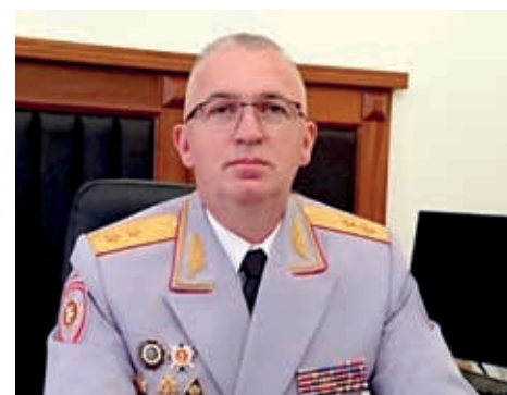
Гарри АРШБА, генерал-лейтенант, министр внутренних дел РА

Госавтоинспекция При росте количества автотранспорта, интенсивности дорожно-транспортного движения, усилении предупредительно-информационных работ, профилактических и рейдовых мероприятий со стороны Госавтоинспекции,