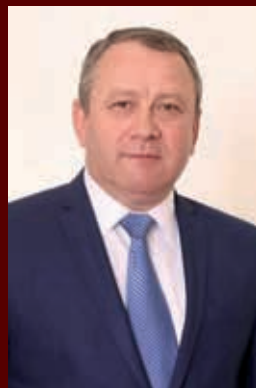
Аслан Барциц, кандидат в вице-президенты РА