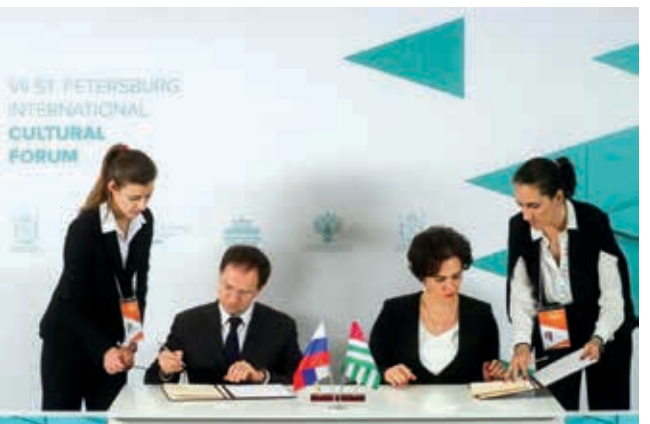
Ихәссыз ашықәсқәа ирылагзны, акультура еимадарақәа ахәақәа иртәгзаны, еиҕааан ауснагзатәқәа жәпаки: аказаратә коллективқәа ргастрольқәа, асахьатыхыцәа рцыргәкәтәқәа, хрылахьын афестивальқәа, алитературатә цхьарақәа. Ацсны имөапысит Ингушетиа Амшқәа, Адыгеиа – Ацсны Амшқәа, алитературатә Ацсуа-Адыгатә фестиваль «Ритцатәи арифмақәа». Ацсны имөацған еицырдыруа Нхьыц-Кавказтәи ансамбльқәа ргастрольқәа: Адыгеиятәи Ахьынтқарратә академиятә жәлар рыкәашаратә ансамбль «Нальмес», Ахьынтқарратә академиятә акәашаратә ансамбль «Кабардинка», Аахыц Уапстәыла Ахьынтқарратә ашәахәарәи акәашарәи ансамбль «Симд» ухәа егыртҕыи.

2018 шықәса нанҳамза 26 рзы Ацсны Ахьынтқарра Ахьыцшымра Жәларбжьаратәи азхатара 10 шықәса ахыцра азгәатарә ахәақәа иртәгзаны, Ацсны Ахьынтқарра Акультуреи атоурых-культуртә тыхна ахьчарәи рминисттра, Ацсны Ахьынтқарра Адәныкәтәи аусқәа рминистрра рыцхьыраара имөапыгеит Аишәа гьежкәа «Ацсны жәларбжьаратәи акультура еимадарақәеи» атемала. Аишәа гьеж аусура рхы аладырхөит еиуеицшым атәылақәа – Урыстәыла, Германия, Тьркәтәыла рхатарнақәа. Аишәа гьеж тема хадас иаман ИУНЕСКО жәларбжьаратәи аконвенция атезис – атәылақәа рыбжьара акультура еимадарақәа рроль хада, аимадарақәа рзы иманшәалоу аҕагылазашьа аццара.