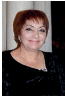
Светлана ҚАРСАИЯЕВА Атеатртцаафы, аказаратцаара акандидат

Ацсны Ахэынцкарра Акультуреи атоурых-культуртэ тынха ахьчареи рминистрра апресс-матцура