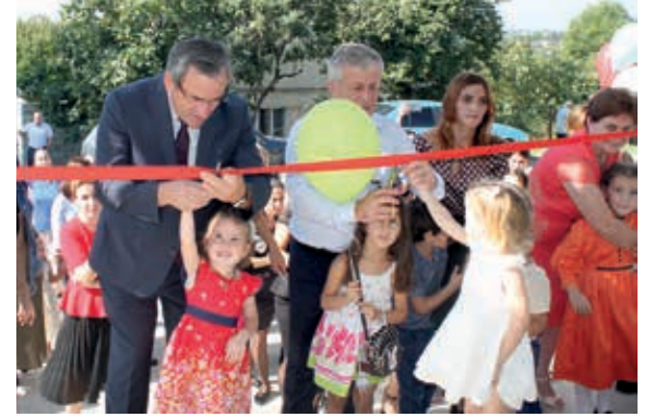
оуп, иҕыцзоу ацаратэ стандартқәа ралагаларәи ақытәғәтәи арцақәа разырхиарәи ацхьараара рытәреи рзы аусқәа зегьы еиҕаауп.

Ацсны Ахьынтқарра Ацара азакәан адкылара иазырхи-