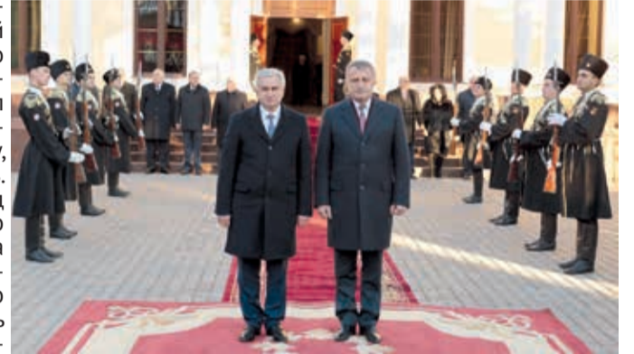
С президентом Республики Южная Осетия Анатолием Бибиловым

отдыха детей в Абхазии, дает возможность подрастающему поколению непосредственно увидеть и услышать то, чем живет страна их предков. Необходимо, чтобы главы администраций, министры, руководители других госструктур оказывали реальную поддержку Министерству репатриации в создании условий, необходимых для вовлечения наших соотечественников в жизнедеятельность государства. Я уже говорил, что для абхазов, вернувшихся в Абхазию и обосновавшихся здесь, ставших