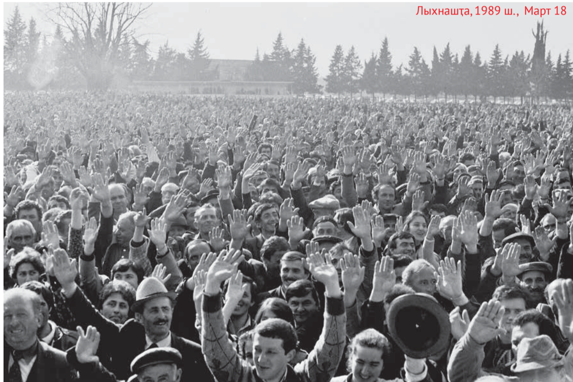
Лыхнашта, 1989 ш., Март 18