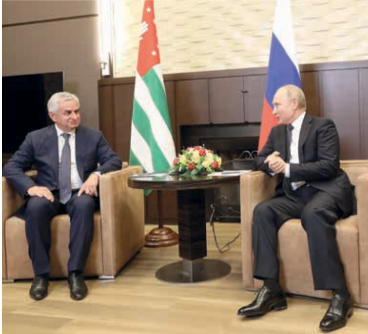
С президентом Российской Федерации Владимиром Путиным

Создан институт судебных приставов, призванный обеспечить выполнение принятых судебных решений. Невозможно в одночасье добиться действенности всех этих сложных механизмов. Но мы не намерены отступать. Борьба за законность и правопорядок будет продолжаться.