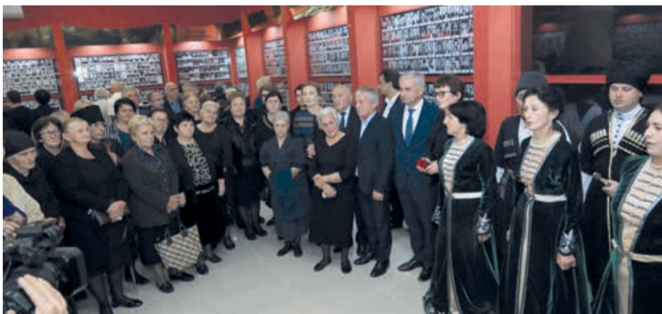
В гудаутском музее Отечественной войны народа Абхазии им. С. Дбар

– Да, я все время говорю о необходимости единства и сплоченности народа, потому что без такой консолидации мы не сможем построить полноценное государство, отстоять базовые ценности, на которых зиждется это государство. Мы одержали победу над грузинскими агрессорами, многократно превосходившими нас, потому что в час беды мы все были вместе, нас сближала судьба Родины. Думаю, что политические разногласия не могут быть причиной опасного противостояния. Кто бы ни победил на предстоящих выборах, главной задачей руководителя должно стать именно объединение людей, вне зависимости от политических пристрастий и взглядов.