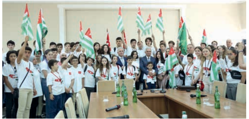
На встрече с детьми наших соотечественников из Турции и Иордании

строй немалое количество объектов туристического и сельскохозяйственного направления. Растет количество рабочих мест. Значительно вырос объем продукции, производимой овощеводческими хозяйствами, тепличными комбинатами, сооруженными на основе современных технологий с использованием термальных вод. Общий объем выращенной продукции составил около семи тысяч тонн. Абхазия входит в число стран, поставляющих на российский рынок наибольший объем винной продукции.